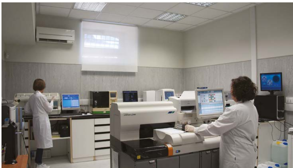
ANALISI AD ALTA TECNOLOGIA CON TOTALE INTEGRAZIONE DELLE FASI OPERATIVE.