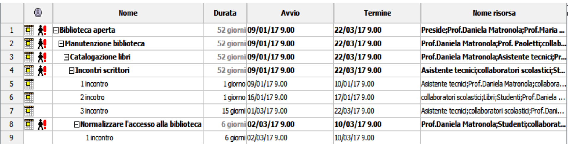
DIAGRAMMA DI GANTT